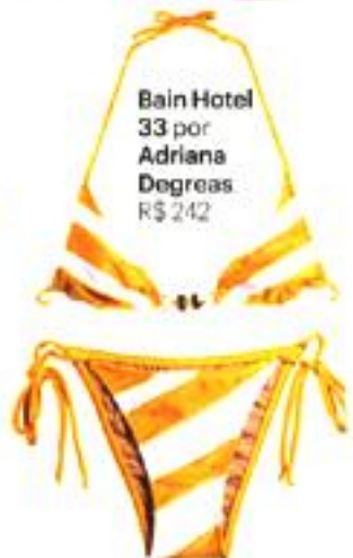
Bain Hotel 33 por Adriana Degreas, R$ 242