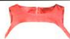
Morena Rosa, R$ 530