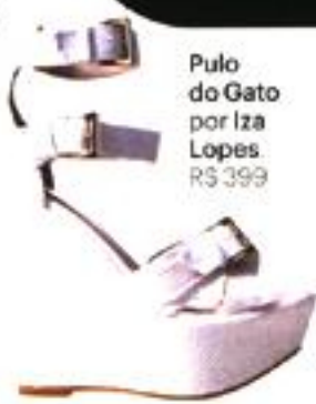
Pulo do Gato por Iza Lopes, R$ 399