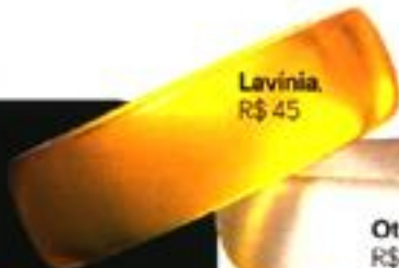
Lavinia, R$ 45