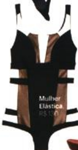
Mulher Elástica, R$ 120