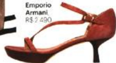
Emporio Armani, R$ 2.490