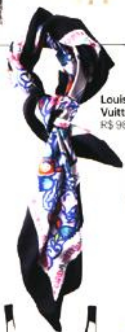
Louis Vuitton, R$ 980