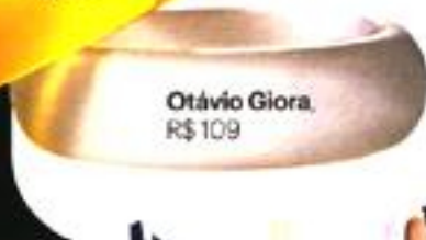
Otávio Giora, R$ 109