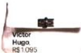
Victor Hugo, R$ 1.095